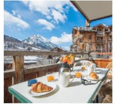
Remarkable location, lovely open views.