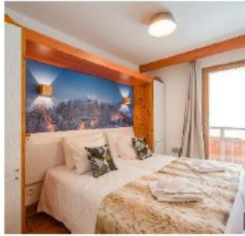
Flats equipped exclusively with floor beds