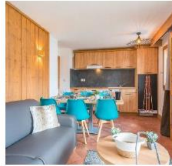
Larger flats than those in the same range