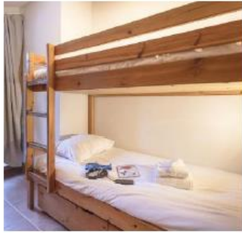
Flats with bunk beds in the second bedroom